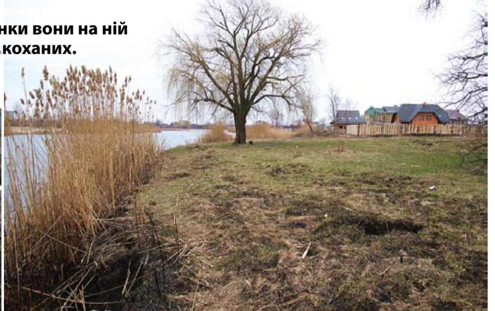
Власна річка, власний пляж. Правда, присмно?