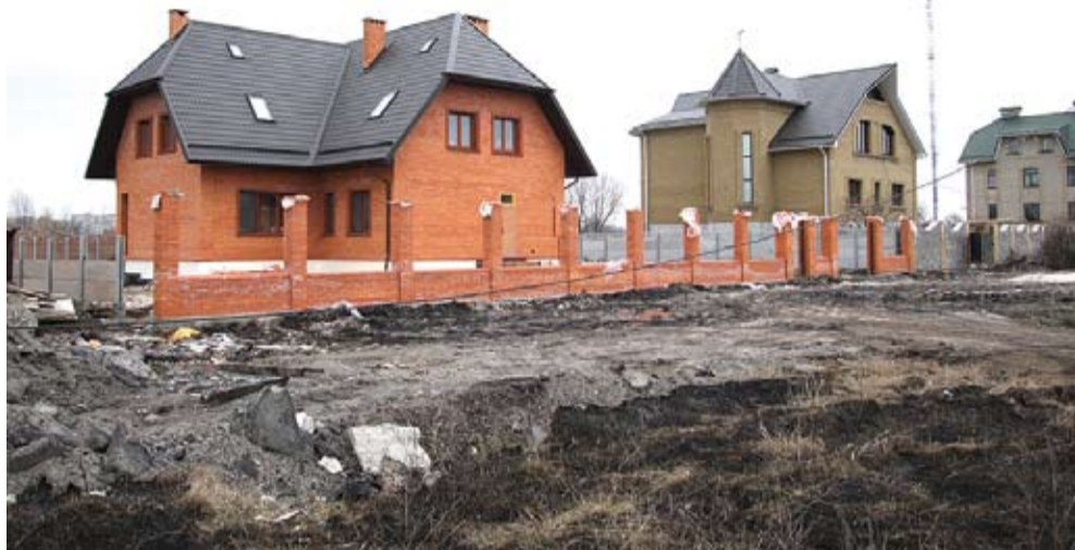
Такими симпатичними котеджами забудовують Царське село-2

Як отримують землю кременчуцькі чиновники, які будинки вони на ній зводять, та як використовують бюджетні кошти на себе, коханих.