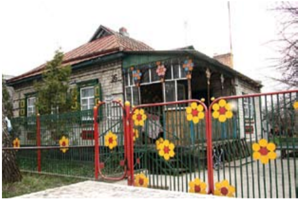
Це – юридична адреса ПП «Монолітбудтранс», де його насправді немає.