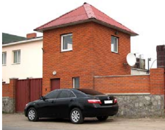
Тут насправді знаходиться ПП «Монолітбудтранс»