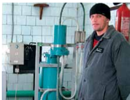
Задоволений ув'язнений біля сучасного знезаражувального апарату «Плама» (знезаражує мокротиння та фекалії протитуберкульозної лікарні).

У 2007-му у протитуберкульозній лікарні померли 6 ув'язнених. У 2008-му – 3. У 2009-му – 0.