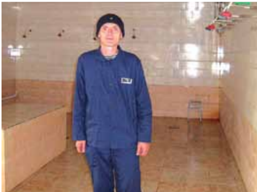
Задоволений ув'язнений у новому відремонтованому душовому комплексі.