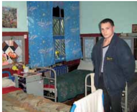
Відносно задоволений ув'язнений у відносно затишній камері протитуберкульозної лікарні.